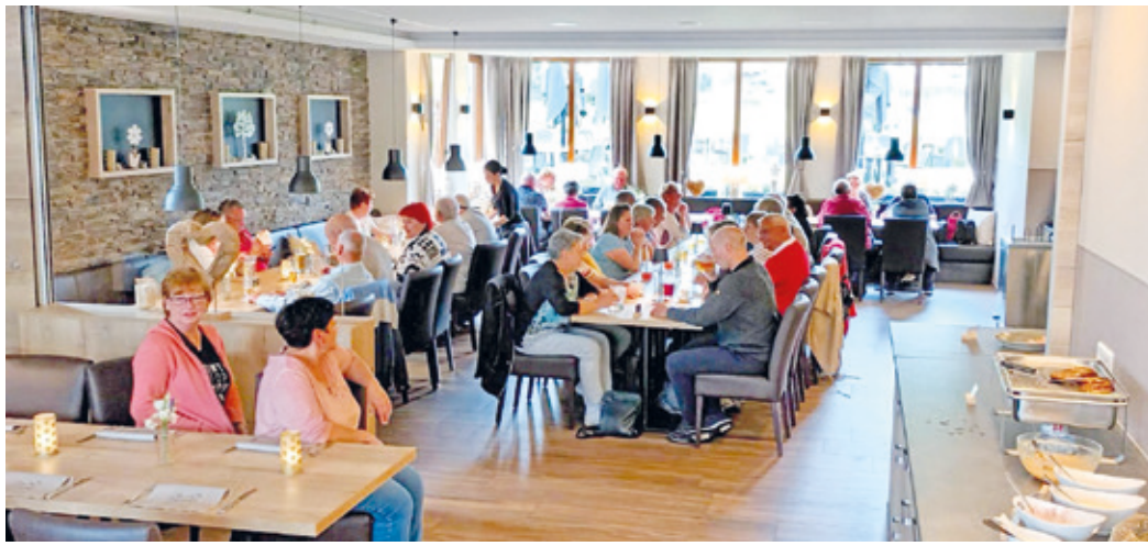
Die Wixhäuser Ausflügler genossen das Reibekuchenbuffet im Restaurant des Landhotels Ewerts im kleinen Ahrtalort Insul.

Wixhausen (kw). Nach einer schönen Busfahrt mit dem Busunternehmen Millireisen erreichten die Wixhäuser VdKler/innen den Treffpunkt mit der Reiseleiterin Tineke von Golen. Anschließend ging die Fahrt vorbei am Nürburgring nach Insul im Landkreis Ahrweiler. Dort war man Gast im Landhotel Ewerts, das in dritter Generation geführt wird. In den neu gestalteten Räumen konnte man sich bei einem reichhaltigen und besonders leckerem Reibeku-