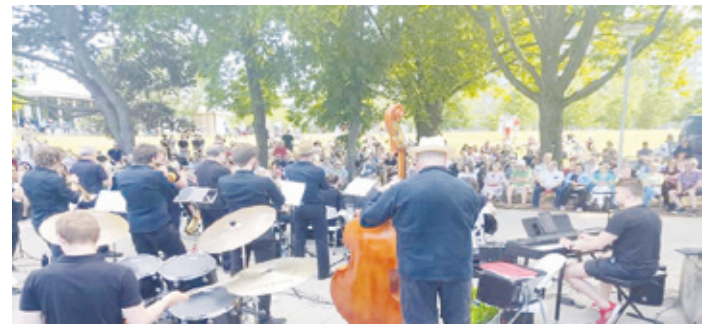
Musik Am See mit der TU-Big Band 2023

Musik Am See: Am Sonntag, 07. Juli, 16 Uhr auf der Seebühne am Ufer des Brentanosee